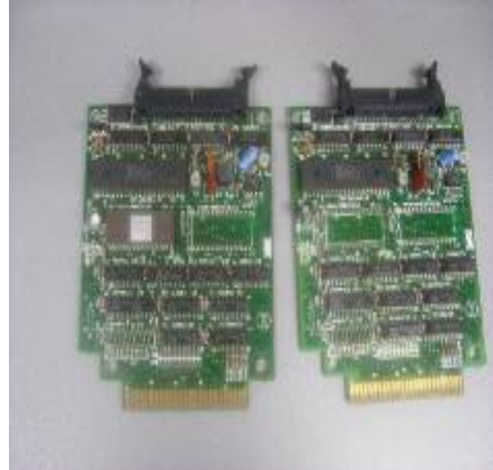
Links: Interface met Eprom