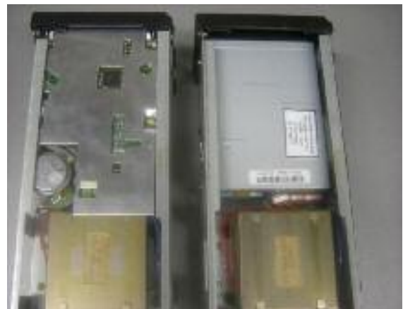
Links: originele enkelzijdige diskdrive Rechts: nieuwe dubbelzijdige diskdrive

Nadat de enkelzijdige diskdrive is verwijderd kan de nieuwe dubbelzijdige diskdrive gemonteerd worden. Schuif deze vanaf de voorzijde naar binnen. Sluit eerst de voeding en de diskdrivekabel aan en schuif nu de diskdrive helemaal op zijn plaats.