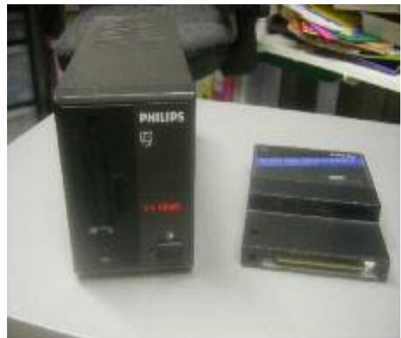
De Philips VY 0010 met interface in originele staat

De meeste externe diskdrives voor de MSX hebben een opslagcapaciteit van 360 kB. De diskettes worden dan enkelzijdig gebruikt. Er zijn vele merken externe diskdrives en een ombouw naar 720 kB (dubbelzijdig) komt grotendeels overeen met de hier omschreven ombouw. Als voorbeeld is hier de meest voorkomende diskdrive gebruikt; de Philips VY0010 met interface. De interface is nodig wanneer de MSX geen eigen diskdrive heeft, of als deze als 3 e , 4 e , 5 e of 6 e diskdrive gebruikt gaat worden.