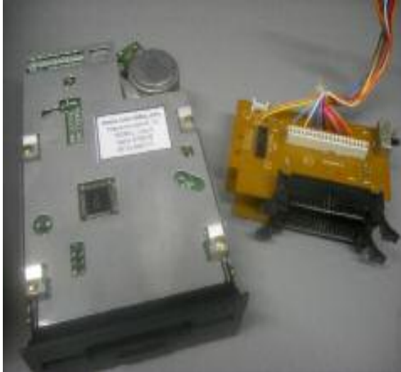
Deze onderdelen zijn niet meer nodig