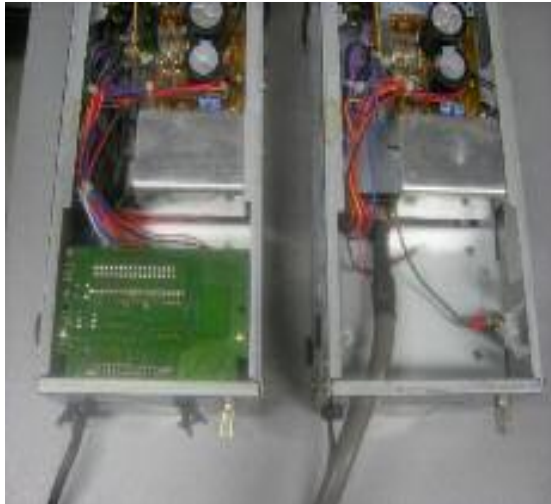
Links: originele staat Rechts: de printjes zijn verwijderd

Het voedingskabeltje van de printjes kun je los laten hangen, deze wordt niet meer gebruikt.