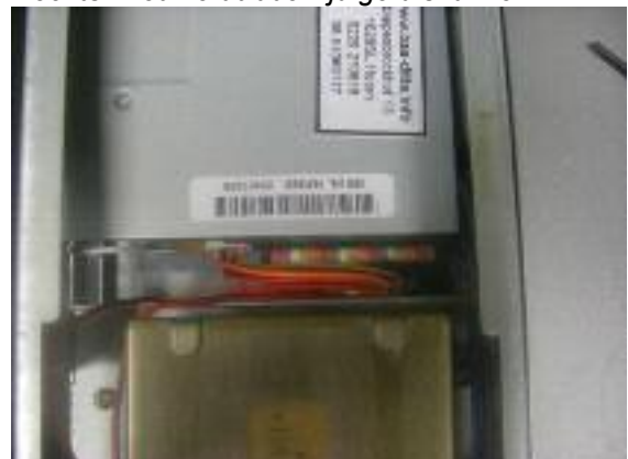
De kabels zijn aangesloten op de nieuwe dubbelzijdige diskdrive