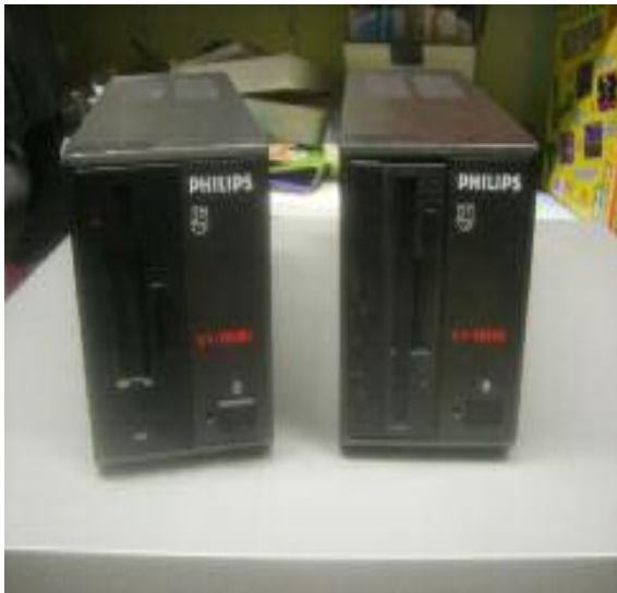
Links: voor de ombouw

Bij de meeste types interface is de Eprom van het type 27C128. In het geval van het voorbeeld heb ik een zgn. Snelle Diskrom gebruikt, welke ik ook gebruik in een Philips NMS 8250. Soldeer de Eprom rechtstreeks op de printplaat of gebruik een 28-pins IC-voet. Hierna is de hele ombouw klaar.