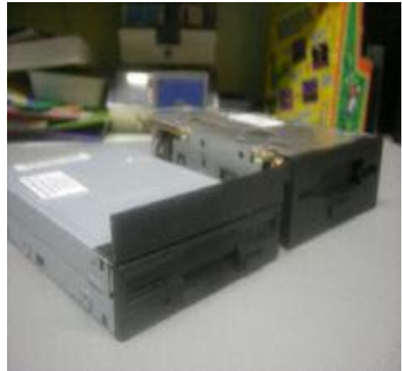
Links: dubbelzijdige diskdrive met hoeklijn Rechts: originele enkelzijdige diskdrive

De diskdrive die je nodig hebt moet wel geschikt zijn voor het gebruik op een MSX-computer. Voor het gebruik als A- of B-drive moet deze wel juist ingesteld worden. Voordat de diskdrive gemonteerd wordt deze voorzien van een opvulstrookje, zodat deze dezelfde hoogte krijgt als de originele enkelzijdige diskdrive. Ik gebruik hiervoor altijd zgn. keukenhoeklijn van 15 mm hoog. Dit kun je met kit of dubbelzijdig plakband op de diskdrive vastzetten. De originele enkelzijdige diskdrive kan eenvoudig verwijderd worden.