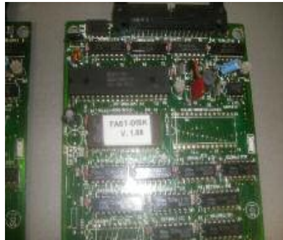
De Diskrom is geplaatst

Bij een IC-voet is het verwijderen van de Rom veel eenvoudiger.