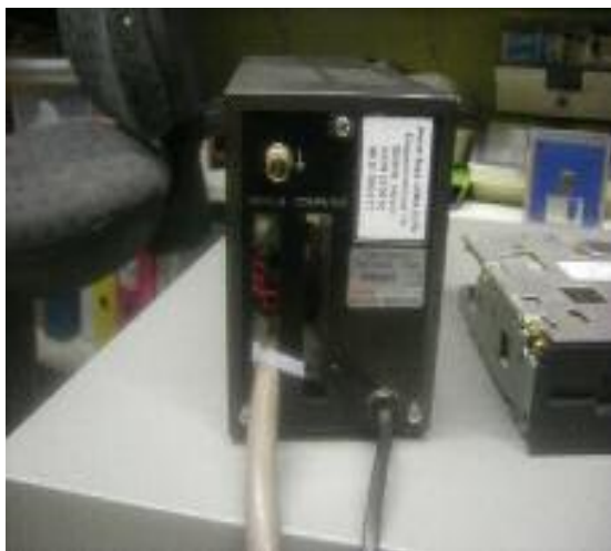
Tyrap gebruikt als trekcontlasting

De diskdrive die je nodig hebt moet wel geschikt zijn voor het gebruik op een MSX-computer. Voor het gebruik als A- of B-drive moet deze wel juist ingesteld worden. Voordat de diskdrive gemonteerd wordt deze voorzien van een opvulstrookje, zodat deze dezelfde hoogte krijgt als de originele enkelzijdige diskdrive. Ik gebruik hiervoor altijd zgn. keukenhoeklijn van 15 mm hoog. Dit kun je met kit of dubbelzijdig plakband op de diskdrive vastzetten. De originele enkelzijdige diskdrive kan eenvoudig verwijderd worden.