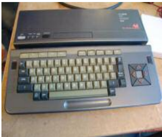
Philips NMS 8240

De ander (naam geheel onbekend) had zelf allerlei programma's ontwikkeld zoals een puzzelprogramma waarbij je zelf het plaatje moet laden en het programma de rest doet. Verder had hij een programma ontwikkeld tesamen met een paar technische snufjes, welke voor het raam moesten hangen, waarbij de MSX tijdregistratie gesynchroniseerd werd met een externe atoomklok.