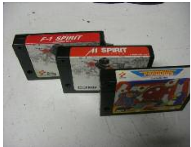
Enkele Konami SCC-cartridges

Solid Snake, Nemesis 3 en Koreaanse SCC-cartridges kunnen wel schakelbaar gemaakt worden, maar volgens een ander schema.