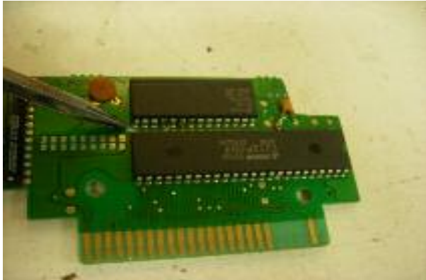
Het doorkrassen van een printspoor