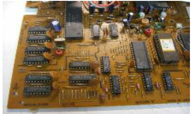
128 kB RAM geheugen