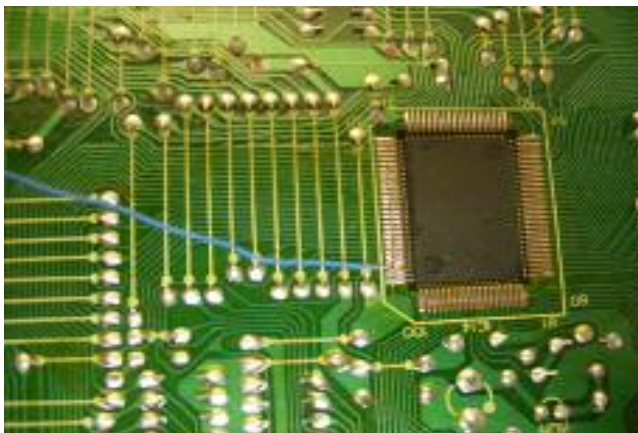
De verbinding met de S1985