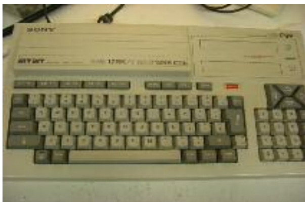
MSX 2 Computer Sony HB-F9P

Het belangrijkste onderdeel in de computer is de printplaat. Onderdelen kunnen vervangen worden, echter de printplaat niet. Probeer de onderdelen niet uit te solderen, maar knip ze los en verwijder daarna de soldeerpinen. Het gebruik van IC-voeten is aan te raden.