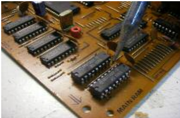
Plaatsen extra geheugenchips