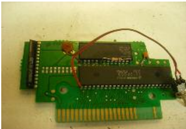
Alles is klaar om ingebouwd te worden