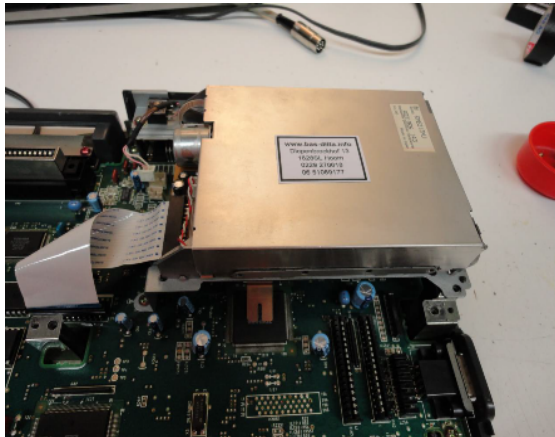
De diskdrive in een Panasonic FS-A1ST

Bouw de diskdrive uit en aan de onderzijde kun je de snaar zien. Deze is zeer eenvoudig te vervangen. Verwijder wel de witte kunststof bracket.