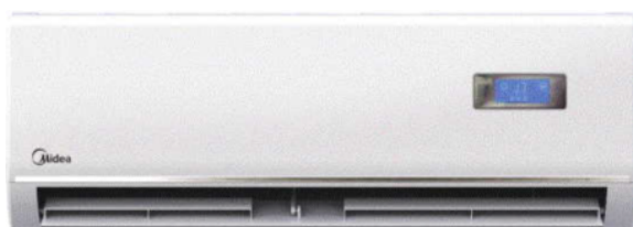
MSX - X Type DC Inverter Wandmodel R410a