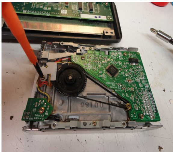
De diskdrive is voorzien van een nieuwe snaar

Bouw de diskdrive uit en aan de onderzijde kun je de snaar zien. Deze is zeer eenvoudig te vervangen. Verwijder wel de witte kunststof bracket.