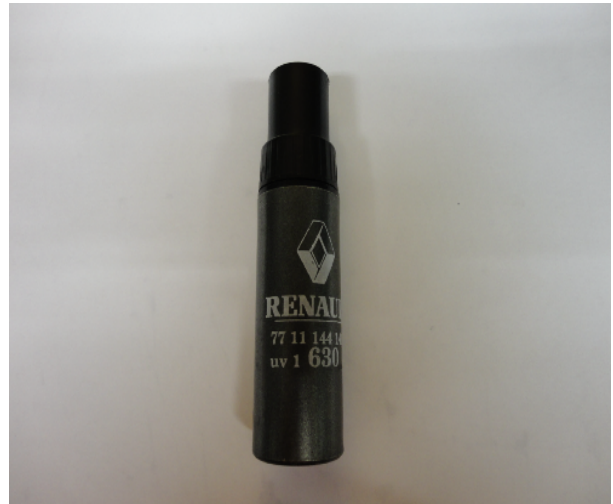
Lakstift Renault, kleurnummer 630

De Philips MSX Computers zijn antraciet van kleur en het is moeilijk om de juiste kleur te bepalen. Ik gebruik altijd een lakstift van Renault, kleurnummer 630, of een spuitbus in dezelfde kleur voor de grotere stukken, zoals een toetsenbordkap van een Philips VG 8235.