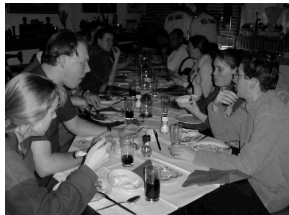
Gezellig eten na de beurs in Oss