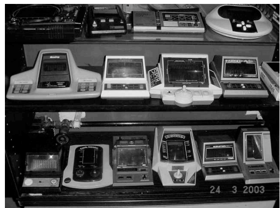
Handhelds, Tabletops en LCD-spellen

De ruimte waar de spel- en homecomputers opgesteld staan is zo'n veertig vierkante meter groot en het maximaal aantal spelende bezoekers zal hierdoor beperkt worden tot vijftien personen. Mocht de toekomst uitwijzen dat er meer bezoekers wensen te komen dan dat wij op dit moment aan kunnen, zullen we zonder problemen uitbreiden door het aantal speldagen te vergroten of hiervoor een grotere ruimte in te richten. Ook wat betreft het aantal apparaten is dat geen probleem, want er is voorraad en variatie genoeg. Iedereen kan hier wel herinneringen ophalen vanwege de grote variatie aan spelcomputers. Voor bijna ieder systeem is er ook een grote voorraad software aanwezig. Zo is het mogelijk om onder andere met de volgende systemen te spelen: Atari, Sega, Videopac, MSX, Nintendo, Commodore Amiga. Tevens hebben we meer dan honderd handhelds, tabletops en LCD-spellen. Ze zijn allemaal te bezichtigen en een groot deel is bespeelbaar.