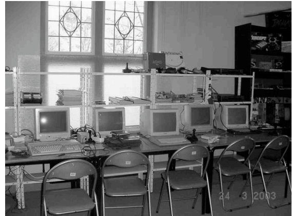
Commodore, Atari, Playstation, MSX

mee te doen", aldus Naomi. Hierdoor is het idee ontstaan om een interactief museum te beginnen. De ruimte is geen probleem. We wonen in een voormalig hotel in de gemeente Epe te Gelderland. Het is een oud gebouw, maar we wonen er gezellig.