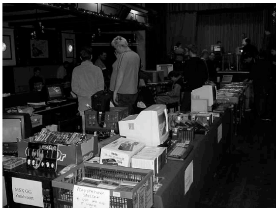
Overzicht MSX-beurs in Oss

Langzaam maar zeker begint de website weer gevuld te raken met informatie en foto's. Tevens is daar nu ook een rubriek "Op de schappen" te vinden waar u kunt kijken wat er momenteel op voorraad is. Momenteel is er een lijst te vinden van tweedehands MSX-computers en bijbehorende MSX-hardware. Tevens een actuele lijst met tweedehands MSX-tijdschriften. Binnenkort komt daar nog een lijst met boeken bij. De komende tijd zullen de foto's van oude clubdagen weer worden geplaatst. We houden u op de hoogte van de vorderingen.