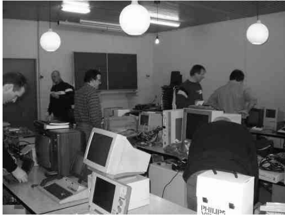
De zaal was vol met oude computers.

Wij hadden wat informatiemateriaal van de club mee en enkele bijzondere Videopac spelcomputers. Velen vonden dit erg leuk om te zien, omdat deze spelcomputers bijzonder zeldzaam zijn.