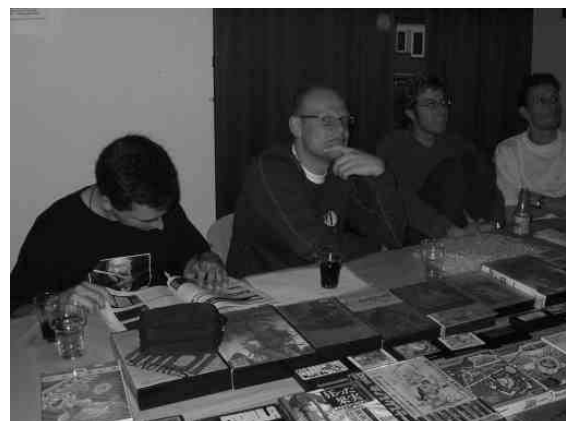
De verkoop van Japanse software

MSX-NBNO had software en het XSW-Magazine meegenomen voor de verkoop.