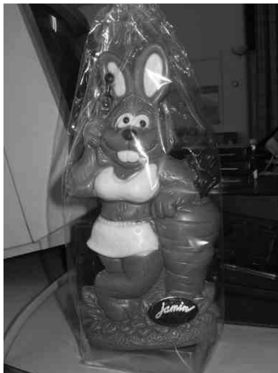
Sexy chocolade paashaas met GSM

Deze prijzen zijn gewonnen door Ditta Visscher en Robert Sprokhold, respectievelijk zevende en tiende plaats. Beide kunnen genieten van het gewonnen flesje wijn. De derde plaats werd beloond met een chocolade paascadeau. Dit was een vrouwelijke sexy paashaas met GSM en werd aangeboden door MSX-Club West-Friesland. Deze is gewonnen door Anne de Raad en hij zal de volgende spelcompetitie verzorgen.