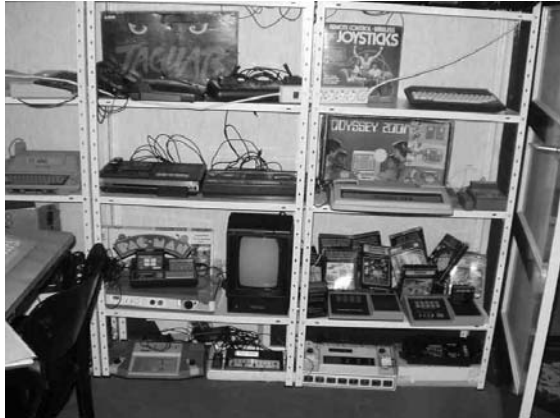
Alles staat netjes uitgestald

druk bezig met het spelen van spelletjes op bekende en onbekende (spel)computers.